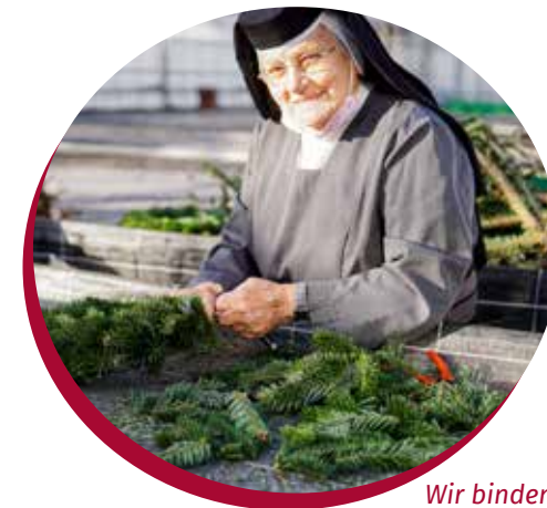
Wir binden mit Leidenschaft